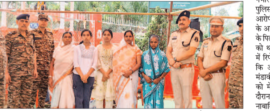
हरिभूमि न्यूज >>> फरसगांव

ब्लॉक के ग्राम पतोड़ा में 7 अप्रैल को शहीद शिवलाल नेताम की छठवीं पुण्यतिथि पर उन्हें भावभीनी श्रद्धांजलि अर्पित की गई। इस अवसर पर हर वर्ष की तरह इस वर्ष भी शहीद के परिजन एवं ग्रामीणों द्वारा स्मारक स्थल पर श्रद्धांजलि कार्यक्रम का आयोजन किया गया। कार्यक्रम के दौरान शहीद शिवलाल नेताम की प्रतिमा पर पुष्प अर्पित कर उन्हें याद किया गया। इस दौरान एसडीओपी अभिनव उपाध्याय, थाना प्रभारी चंद्रशेखर श्रीवास एवं सीआरपीएफ 188 बटालियन के अधिकारी भी मौजूद रहे। अधिकारियों ने शहीद के परिजनों से मुलाकात