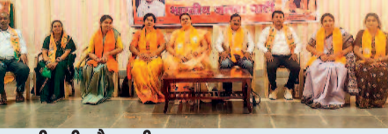
इनकी रही मौजूदगी

फरसगांव। भारतीय जनता पार्टी के मछुवारा प्रकोष्ठ की संभाग स्तरीय महत्वपूर्ण बैठक मंगलवार को दोपहर कोण्डागांव स्थित भाजपा कार्यालय में उल्लाह, अनुशासन और संगठनात्मक ऊर्जा के साथ संपन्न हुई। बैठक में बस्तर संभाग के विभिन्न जिलों से पहुंचे पदाधिकारी एवं कार्यकर्ताओं की सक्रिय, प्रभावशाली और उल्लेखनीय भागीदारी देखने को मिली, जिससे संगठन की मजबूती और समर्पण का परिचय मिला। बैठक के दौरान संगठन को जमीनी स्तर पर और अधिक सशक्त एवं गतिशील बनाने, मछुवारा समाज की ज्वलंत समस्याओं के त्वरित एवं ठोस समाधान तथा शासन की जनकल्याणकारी योजनाओं को अंतिम पंक्ति के व्यक्ति तक प्रभावी रूप से पहुंचाने को लेकर गंभीर एवं व्यापक मंथन किया गया। वक्ताओं ने समाजहित में आपसी समन्वय,